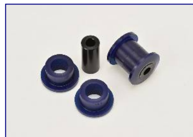
ロアアームフロントプッシュ ¥8,000-