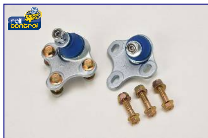
ロールセンターアジャストボールジョイントキット ¥32,000