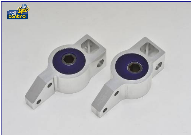
ロアアームリアブラケットキット ¥30,000-