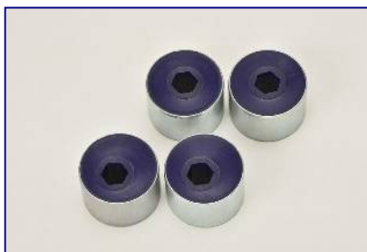
リアブラケットインナープッシュ ※1 ¥19,800-