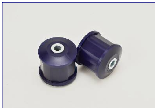
リアトレーリングアームフロントプッシュ ※2 ¥11,500-