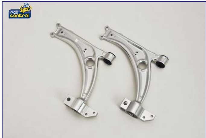
フロントロアアーム スパロイキットAssy ¥68,000-